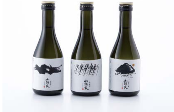
左から 本醸造、吟醸、純米吟醸 各300ml・3本セット：2,000円(税込)