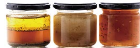
大将の一滴 (和風ドレッシング) 塩・たまねぎ・だいだい 各864円(税込)