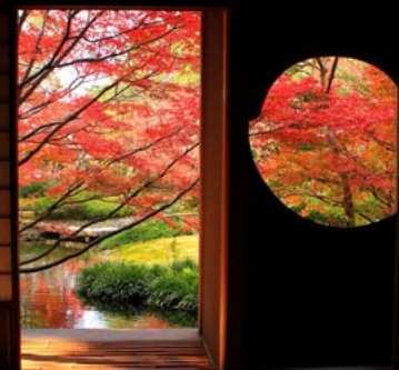
紅葉が見事なお茶室 芳松庵