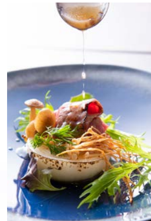
いつものグリル料理もこの「一滴」でプロの味に