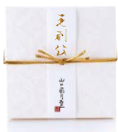
秋「毛利公」 毛利公(3個) 750円(税込)

山口風月堂 「四季折々山口めぐり」 創業1897年。西の京と呼ばれる山口の地を四季折々の和菓子で表現する「山口めぐりシリーズ」。 初代店主の栄之進が秋吉台の大理石にちなんで考案した「大理石」をはじめ、週替わりで山口の風情が店頭に並びます。 写真は防長登録銘菓の一つ「毛利公」。厳選したもち米を焼き上げた最中皮と、山口県特産の夏みかんを用いたマーメイドを加えた爽やかな餡が自慢の一品です。茶会の席でも喜ばれている銘菓シリーズをご賞味ください。