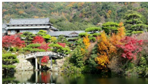
国指定名勝 毛利氏庭園