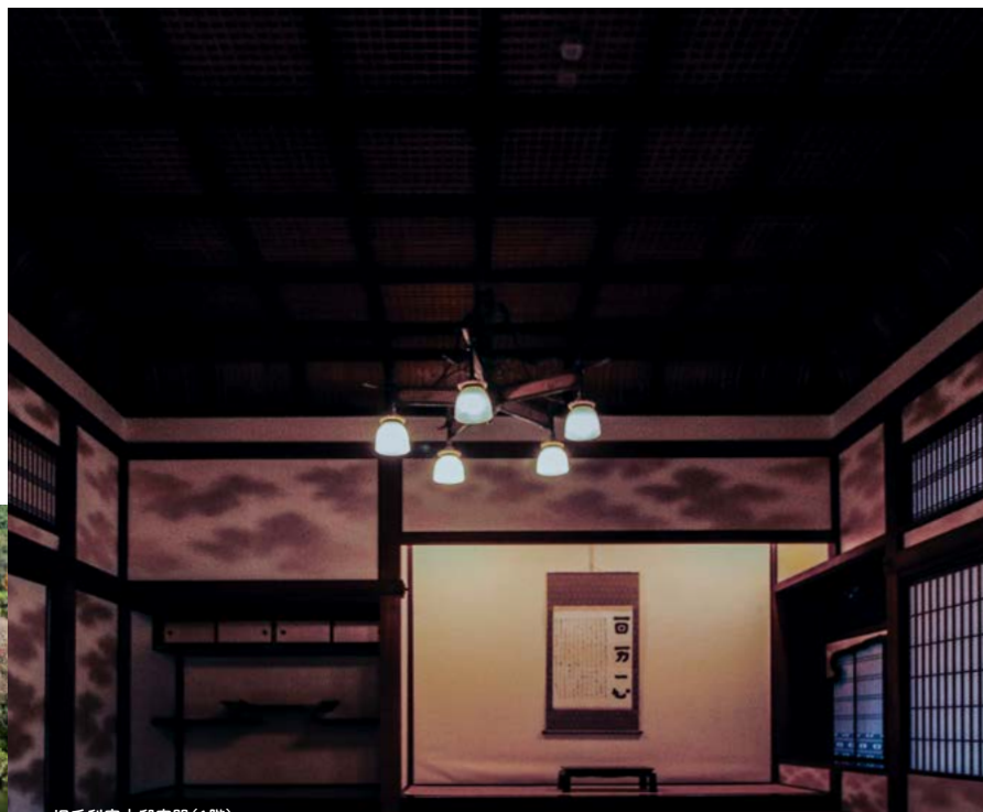
旧毛利家本邸客間(1階)

防府市の旬を日本料理で表現する、人気の割烹「いち遊」の板場から和のソースが誕生。山口県産素材と天然出汁の組み合わせで素材の味を引き立てる、ドレッシングに留まらない調味料です。様々な料理がこの一滴でいつもと違う味わいに。