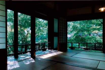
暁天楼 (現在一般非公開)