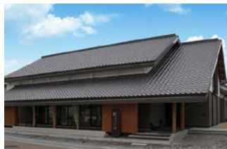
山頭火ふるさと館